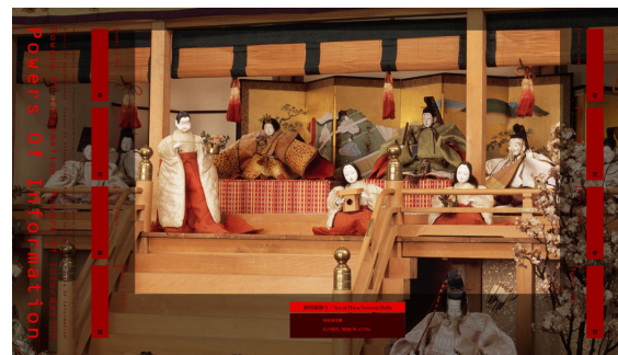
作品から高精細画像へ、画面いっぱい拡大できます