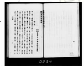
(株)国際マイクロ写真工業社製 KmView