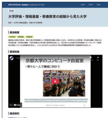
(左)教育機関DXシンポ・アーカイブズの画面。(右)アーカイブズでセレクトした詳細ページの参考例(第90回・喜多 一先生の講演より)