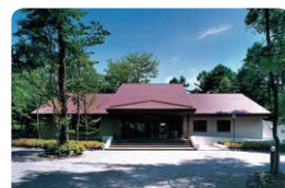
セミナーハウス 長野県北佐久郡軽井沢町大学軽井沢学長倉往還南原1052-471