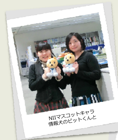
NIIマスコットキャラ 情報犬のビットくんと