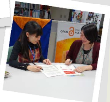
研修風景 成果報告会に向け鋭意準備中!