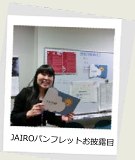
JAIROパンフレットお披露目