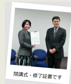
閉講式・修了証書です