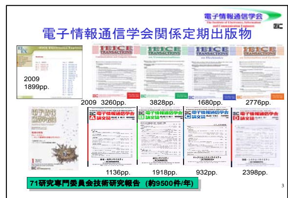
(図1) 電子情報通信学会関係定期出版物

和文論文誌は1968年創刊、英文論文誌「IEICE Transactions」は1976年創刊で、「IEICE Electronics Express」(「ELEX」)は毎月2回、10日と25日に発行しています。「ELEX」の立ち上げ時には、SPARCの最初の年度のときにいろいろ支援をしていただき、