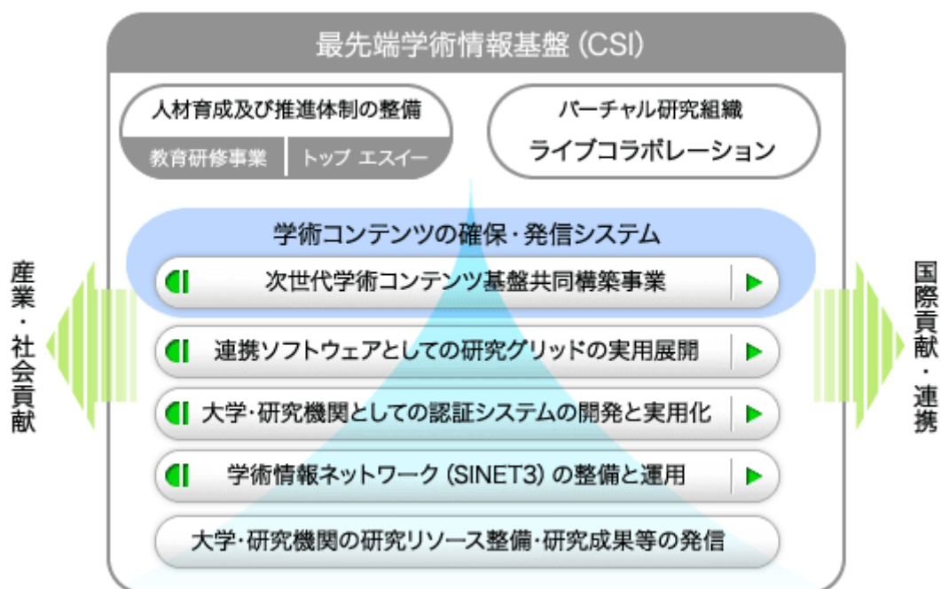
図1：最先端学術情報基盤（CSI）

国立情報学研究所（NII）では，最先端学術情報基盤（サイバー・サイエンス・インフラストラクチャ：CSI）により，「コンピュータ等の設備，基盤的ソフトウェア，コンテンツ及びデータベース，人材，研究グループそのものを超高速ネットワークのうえで共有する」ための基盤構築を推進しています（図1）。