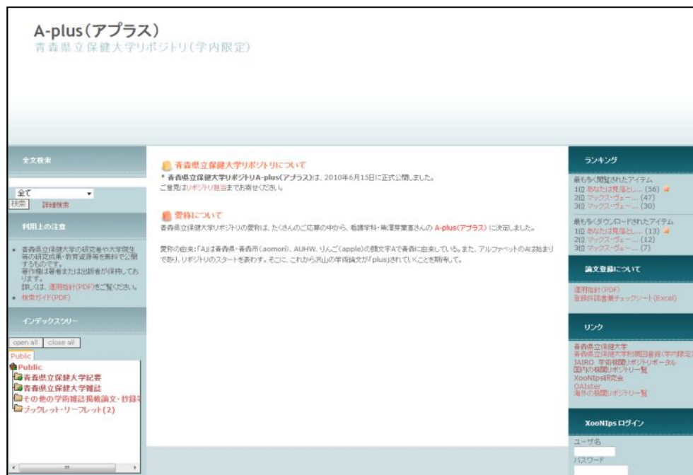
学内限定試験公開サイト(イメージ)