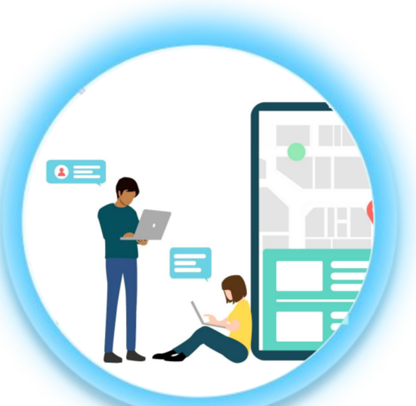
コミュニケーション