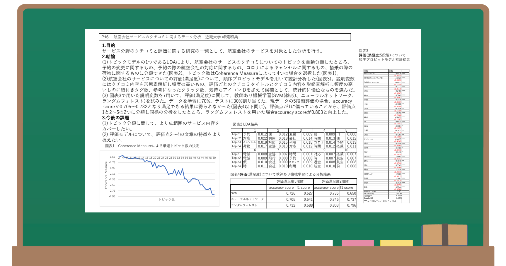
航空会社サービスのクチコミに関するデータ分析 https://www.nii.ac.jp/dsc/idr/userforum/poster/IDR-UF2022_P16.pdf